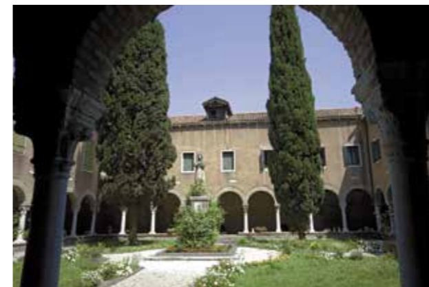
Convento San Francesco della Vigna Castello, Venezia