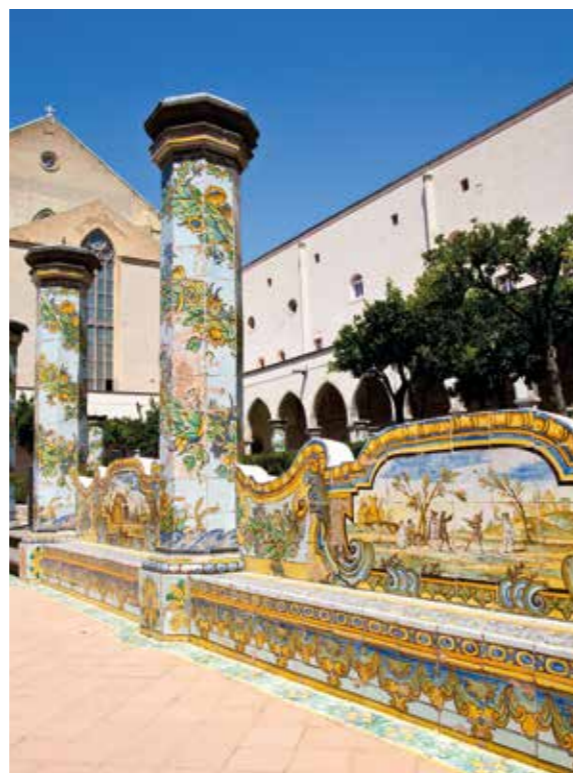
Complesso Monumentale di Santa Chiara Via Santa Chiara, Napoli