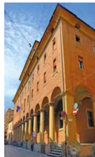
Collegio San Luigi Via D'Azeglio, Bologna