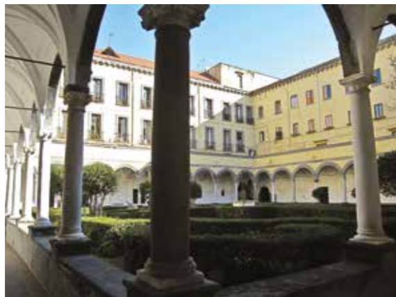
Complesso Monumentale di Santa Maria La Nova Piazza Santa Maria La Nova, Napoli

Giunto il momento di verifica delle conoscenze acquisite, l'Università Telematica Pegaso offre la possibilità di sostenere esami orali e scritti presso le sedi centrali dell'Ateneo: collocazioni prestigiose costituite dai complessi Museali di Santa Maria La Nova e di Santa Chiara, nel centro storico di Napoli.